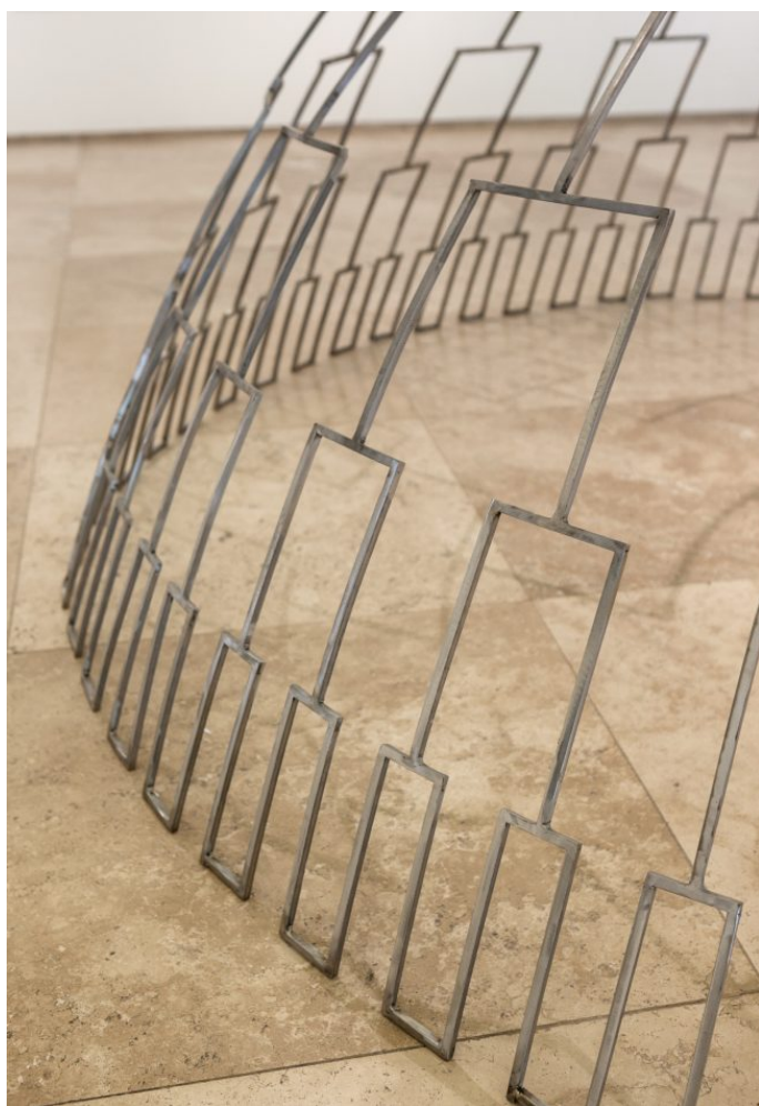
Contacto. La Maloca Como Radio Antena Invertida, 2019, Domo de hierro, 300 cm diámetro x 150 cm de altura