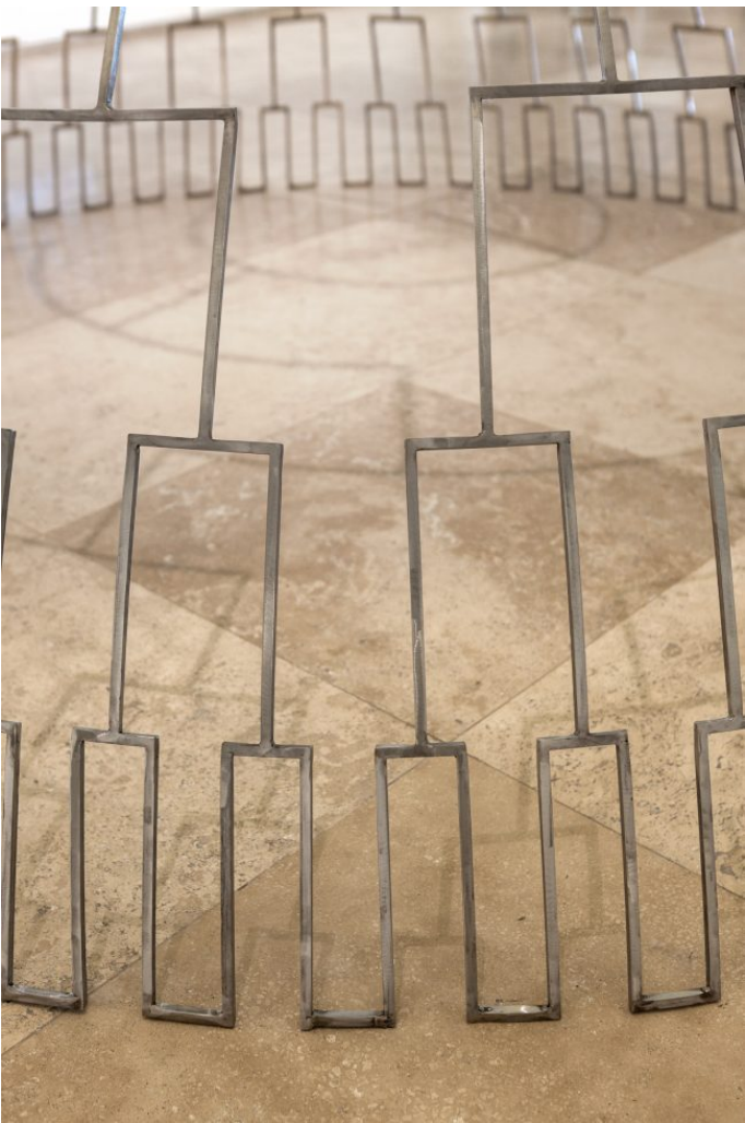
Contacto. La Maloca Como Radio Antena Invertida, 2019, Domo de hierro, 300 cm diámetro x 150 cm de altura