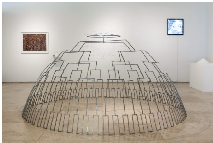
Contacto. La Maloca Como Radio Antena Invertida, 2019, Domo de hierro, 300 cm diámetro x 150 cm de altura